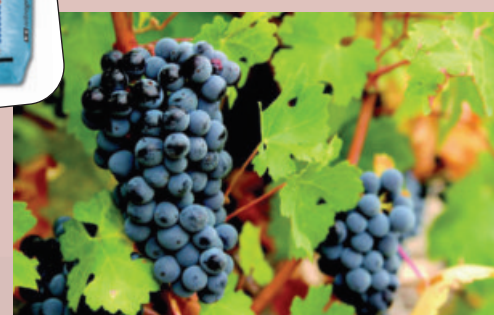
I Nitrophoska® sono concimi ideali per la fertilizzazione primaverile della vite e dei fruttiferi.